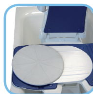
Erleichtert das Ein- und Aussteigen