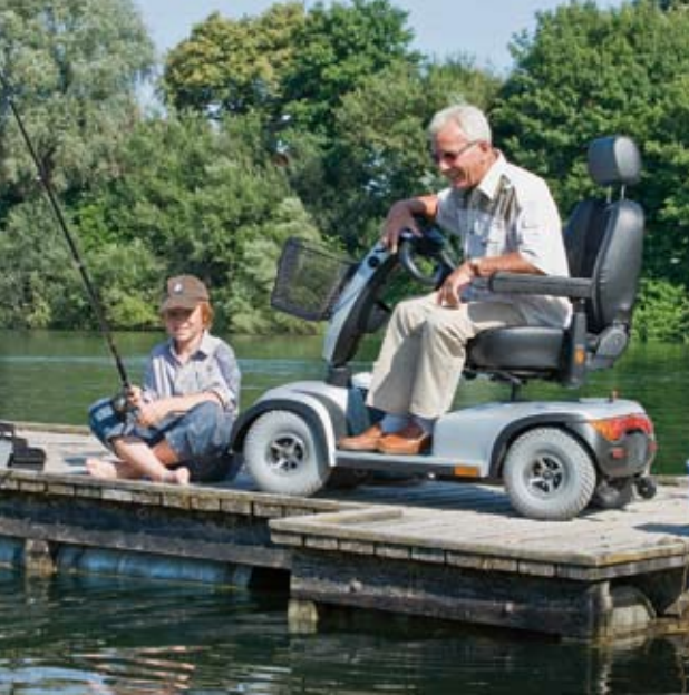
Mobil bleiben, Selbstständigkeit bewahren.

REHACARE DESIGN AWARD 2008/2009 GOOD DESIGN