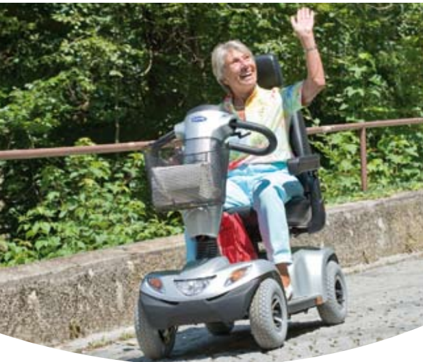
Sicher unterwegs, entspannt ankommen.

Der Invacare® Orion vereint den Fahrkomfort eines großen Scooters mit der Alltagstauglichkeit eines kompakten Fahrzeugs. Der bequem gepolsterte Sitz und die serienmäßige Federung versprechen eine entspannte Fahrt auf allen Straßen und Wegen. Hindernisse, wie zum Beispiel Bordsteine, werden dank der großen Räder und dem kräftigen Motor spielend überwunden.