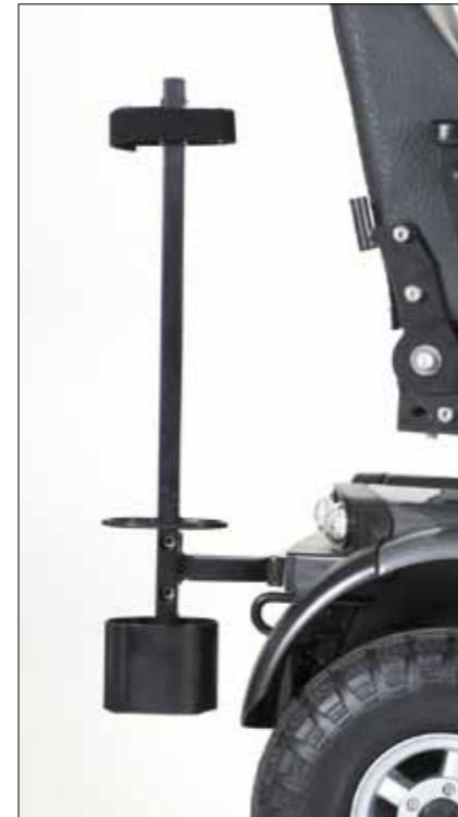
Gehstützenhalter für zwei Gehstützen T-127-06-150