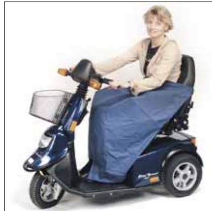
Capes und Fußsäcke Verschiedene Modelle und Größen