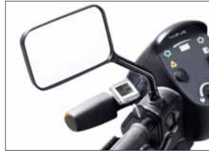
Spiegel Seitenspiegel rechts und links. SR-05206 Recht. SR-05207 Links.