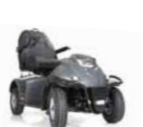
Mini Crosser TJ Joystick-Steuerung Seite 14