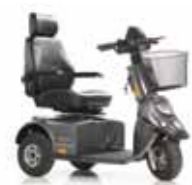
Mini Crosser M-Modell 3 Räder Seite 4

Die Erfahrung hat gezeigt, dass die Möglichkeiten in Bezug auf individuelle Anpassung und Flexibilität für sehr viele Benutzer von entscheidender Bedeutung sind, z. B. bei Rheuma, Muskelschwund, Sklerose, Rückenleiden etc. Oftmals werden nach einer gewissen Zeit ein anderes Gasregelsystem, ein größerer Sitz, zusätzliche Stützen, elektrische Zusatzfunktionen oder sonstiges Zubehör benötigt. Die Mini Crosser M-Serie ist in Kombination mit dem umfangreichen Zubehörprogramm äußerst zukunftssicher. Somit ist der Mini Crosser ein treuer Wegbegleiter, auch dann, wenn sich die Bedürfnisse ändern. Dadurch werden Neuinvestitionen vermieden und eine gute Wirtschaftlichkeit erreicht.