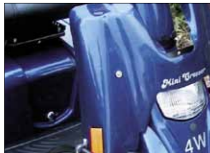
Beinschutzschirm Beinschutzschirm für Mini Crosser M- und MaxX. M-127-1-023 – Nur für 3W, am 4W ist es integriert.