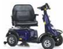
Mini Crosser MaXX HD 2-Motoren-Antrieb Seite 13