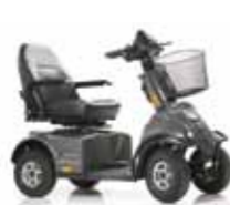
Mini Crosser M-Modell 4 Räder Seite 8