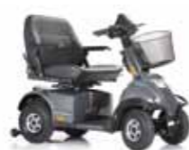
Mini Crosser HD Benutzergewicht 250 kg Seite 12