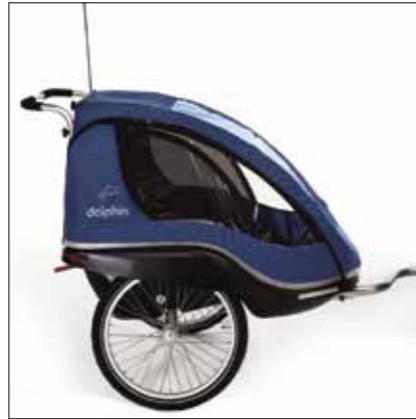
Dolphin Kinderanhänger Nur für M-Modelle und MaxX