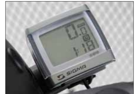
Tachometer Digitaler Tachometer; nur für M-Modelle und MaxX.