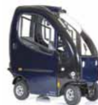
Kabine 4 Räder Seite 15