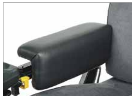
Oberschenkelhalterung. Links oder Rechts Seite 30