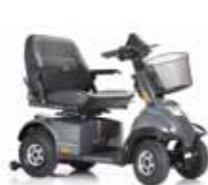
Mini Crosser HD Benutzergewicht 250 kg Seite 12