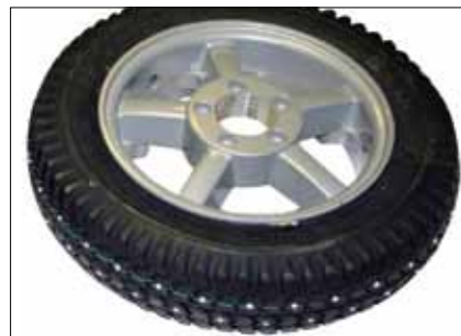
Räder Großes Sortiment an verschiedenen Reifentypen