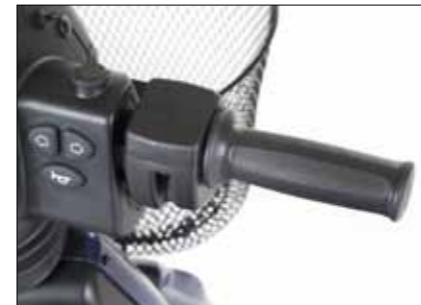
Drehgasgriff Rechts oder links montierbar; nur für M-Modelle und MaxX.