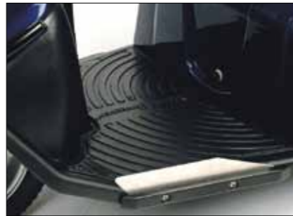
Kantenleiste für Fußbrett Montage rechts und/oder links; nur für M-Modelle und MaxX