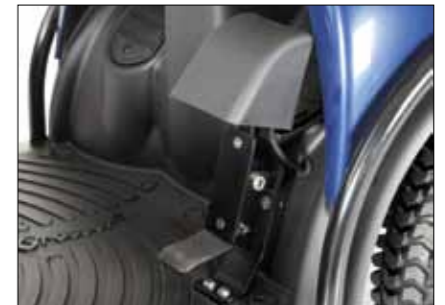
Fußgaspedal Rechts oder links montierbar; nur für M-Modelle und MaxX.