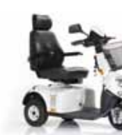
Mini Crosser M2 Modell Seite 22