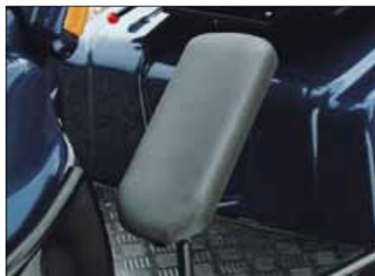
Wadenstütze Links und/oder rechts; nur für M-Modelle und MaxX