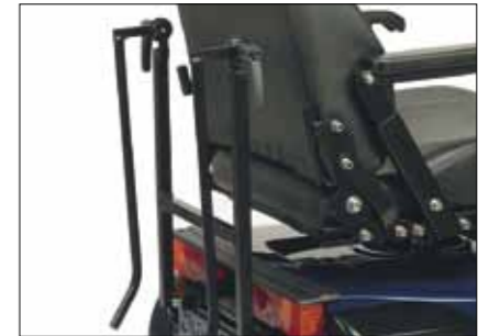
Halter für manuellen Rollstuhl An der C-Schiene zu montieren, max. Belastung 20 kg