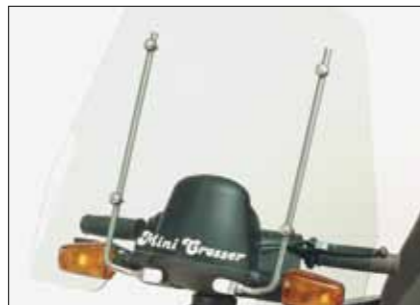
Windschutzscheibe Windschutzscheibe für Mini Crosser M-Modelle und MaxX. T-127-06-165.