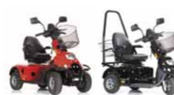
Mini Crosser, auch für Kinder Seite 16