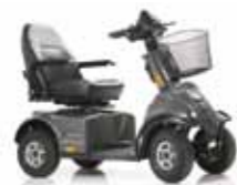
Mini Crosser M-Modell 4 Räder Seite 8