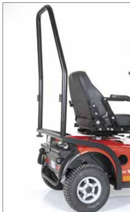
Überrollbügel Nur für M-Modelle und Kid