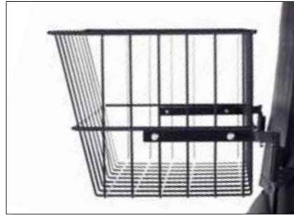
Warenkorb, hinten Warenkorb zur Montage hinten am Sitz. T-127-06-160 Korb hinten am Erwachsenen- sitz, 45 cm. T-127-06-161 korb hinten am junior sitz, 37 cm und 40 cm. T-127-06-162 Korb hinten am Kindersitz, 34 cm.