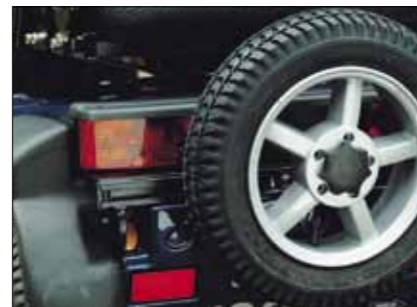
Reserveradhalterung Nur für M-Modelle und MaxX