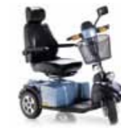
Mini Crosser E-Modell 3 Räder Seite 18