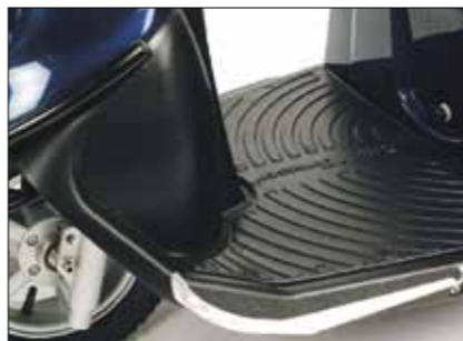
Fußablage Links und/oder rechts; nur für M-Modelle und MaxX