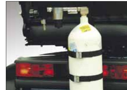
Sauerstoffflaschenhalter Für verschiedene Flaschentypen geeignet. Auch Maßanfertigung von Alternative individuelle Anfertigung mit Eisenbügeln, die die Flasche vor Stößen schützen.