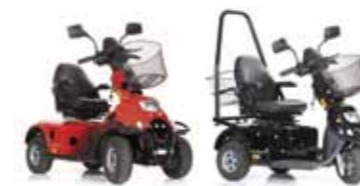
Mini Crosser, auch für Kinder Seite 16