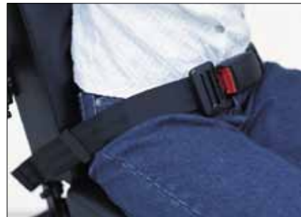
Beckengurt Verschiedene Modelle. T-127-06-144 sicherheitsgurt (beckengurt).