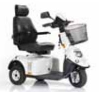
Mini Crosser M2 Modell Seite 22