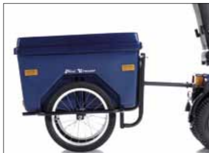
Warenanhänger Für alle M-Modelle und MaxX geeignet.