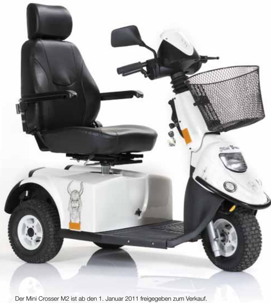
Der Mini Crosser M2 ist ab den 1. Januar 2011 freigegeben zum Verkauf.

Sie haben auch die Möglichkeit, eine Alarmanlage einzubauen.