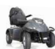
Mini Crosser TJ Joystick-Steuerung Seite 14