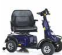
Mini Crosser MaXX HD 2-Motoren-Antrieb Seite 13