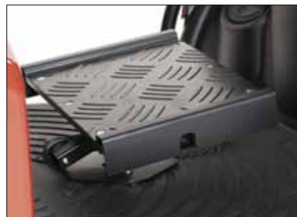
Fußbretterhöhung Höhenverstellbare Beinstütze 3-16 cm, neigungsverstellbar. Alternative Beinstützen in voller Breite nach Maß erhältlich.