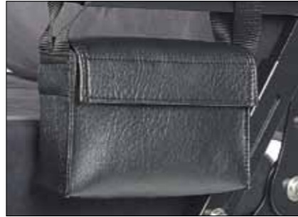
Tasche für Armllehne Ledertasche. C5-0430.