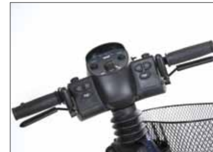
Standard-Gasgriff Montage rechts und/oder links. Alternativ individuelle Anfertigung einer multiverstellbaren Gasregelfunktion gegen Aufpreis möglich, jedoch nicht bei den E-Modellen.