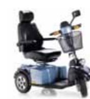
Mini Crosser E-Modell 3 Räder Seite 18