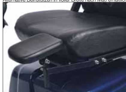
Amputationsstütze Montage rechts oder links; nur für M-Modelle und MaxX