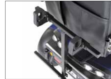
Rollatorhalter Max. Belastung 20 kg.