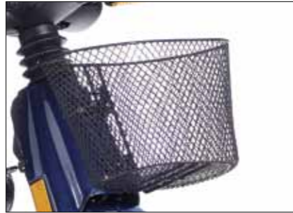
Warenkorb, vorne Als Standard Warenkorb zur Montage an der Lenksäule. M-127-06-163 Warenkorb. M-127-06-560 für Model M-Joy.