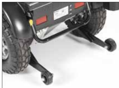
Anti-Kipp-Räder Stützräder mit Anti-Kipp-Funktion