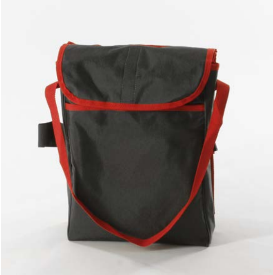
Rückenlehnen-Tasche für Sauerstoff