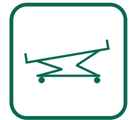
OPTIONAL Trendelenburg- Lagerung