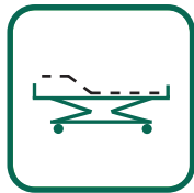
FUSSTEIL 0 - 30°