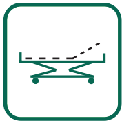
RÜCKENTEIL 0 - 70°